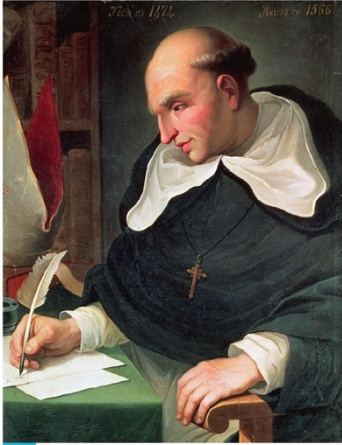
2 Portrait de Bartolomé de Las Casas

La violence de la conquête est fortement critiquée par un moine espagnol dominicain, Bartolomé de Las Casas. En 1550 et 1551, à la demande de l'empereur Charles Quint, il débat à Valladolid avec le prêtre Sepulveda sur la question : peut-on christianiser les Indiens d'Amérique sans utiliser la violence et sans les réduire en esclavage ? C'est la controverse de Valladolid.