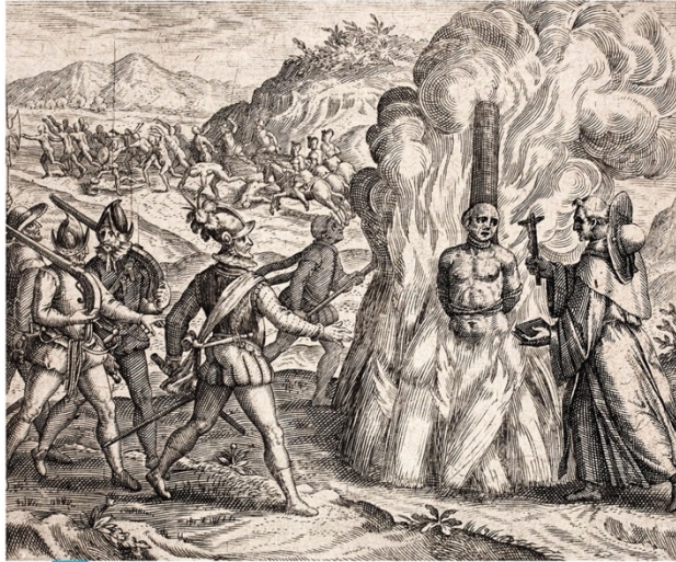
3 Scène de conquête illustrant un ouvrage de Las Casas

(Peinture anonyme, Archivo de Indias, Séville, Andalousie.)