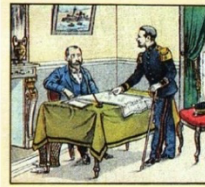
Capitaine à 29 ans, il expose au ministre des Affaires étrangères son vaste et hardi projet de traverser toute l'Afrique avant les Anglais et il en reçoit aussitôt la périlleuse mission.

Le traité d'Algésiras de 1905 confie à la France le pouvoir de police dans 8 villes marocaines. Mais en 1911, la France déploie ses soldats dans d'autres villes. Les Allemands tentent de réagir mais, isolés, finissent par accepter le protectorat français sur le Maroc en échange de compensations au Cameroun et de la préservation de ses intérêts économiques au Maroc.