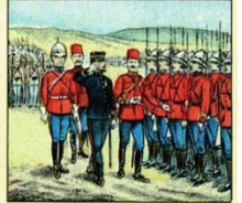
Les tristes nécessités de la politique l'obligent à se retirer: il quitte Fachoda la mort dans l'âme, et reçoit les honneurs militaires de toute l'armée anglaise.