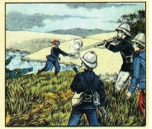
Suivi de son intrépide état-major et de la petite armée de ses fidèles tirailleurs noirs, il traverse les arides déserts et les marécages de la brousse où, à toute minute, il court les plus grands dangers.

Il est l'espoir de la France Vive Marchand!