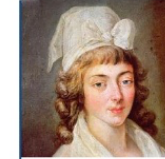
Manon Roland (1754-1793) est un membre influent du parti girondin en 1792 et 1793. → Bio p. 32