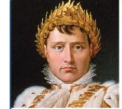
Napoléon Bonaparte (1769-1821) dirige la France de 1799 à 1815 avec le titre de consul puis d'empereur. → Bio p. 38