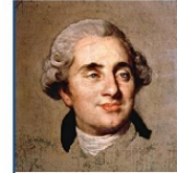
Louis XVI (1754-1793), monarque constitutionnel à partir de l'été 1789, est renversé le 10 août 1792. → Bio p. 14