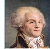
Maximilien de Robespierre (1758-1794), Montagnard, est le principal dirigeant du parti girondin en 1792 et 1793. 1793-1794. → Bio p. 33